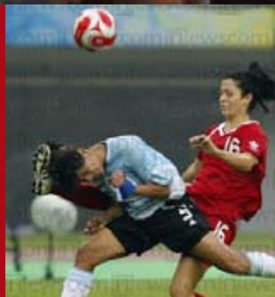
Wśród mężczyzn to by się raczej nie zdarzyło: Kanada ograła Argentynę w piłkę nożną (na Olimpiadzie w Pekinie).